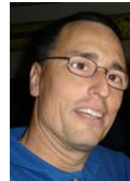
281 Punkte (2 Runden)